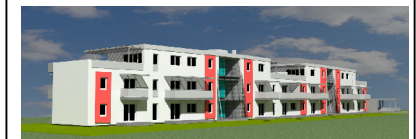
Johann-Koller-Weg 24a / Erdgeschoß